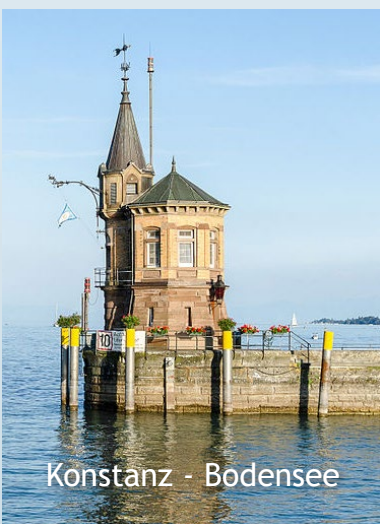
Konstanz - Bodensee